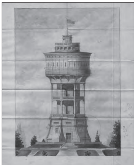
A Szegedi víztorony látványterve