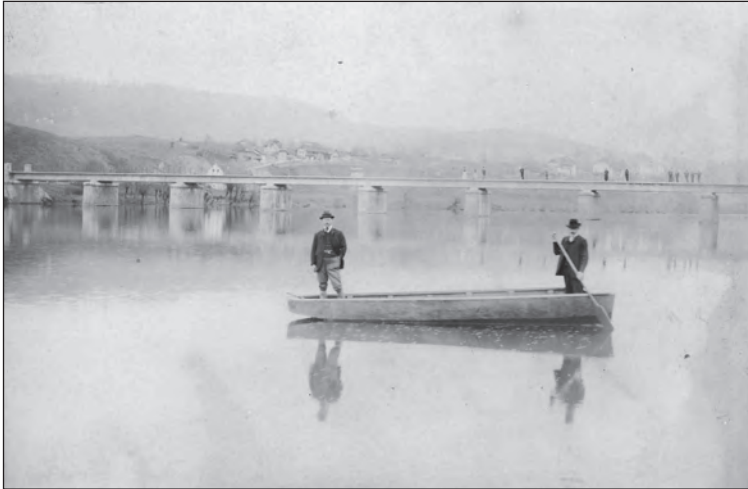
5. kép Elkészült felsőpályás vasbetonhíd