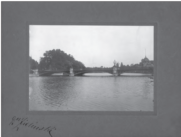
6. kép A városligeti Zielinski híd Budapesten