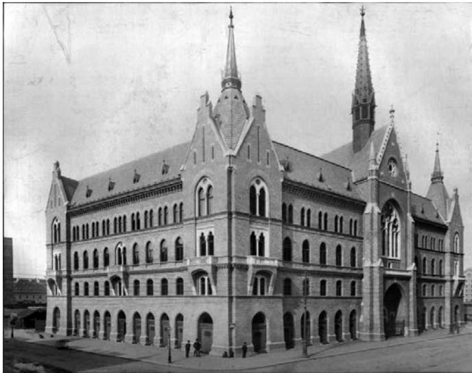
A Koháry utcai templom