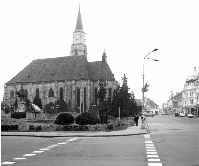
Fotó: Fekete Zsolt, 1999

A kolozsvári Főtér az archeológiai ásítások idején