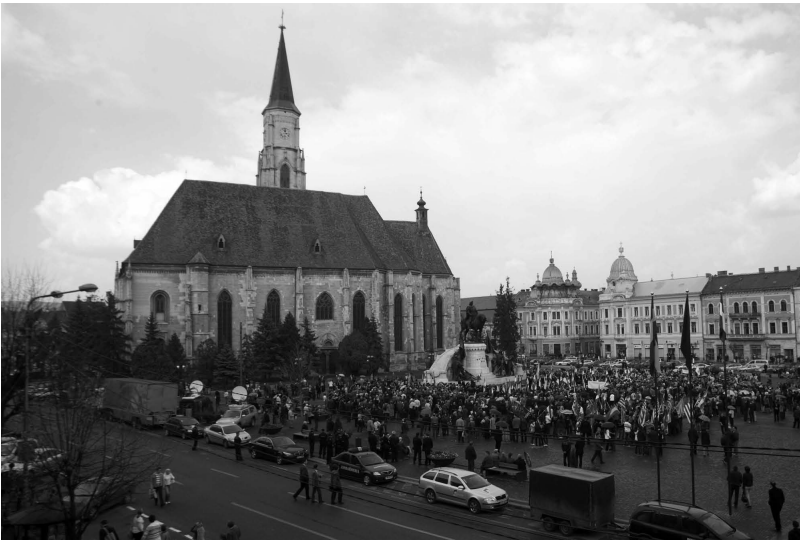
Fotó: Haáz Sándor, 2011

Tavasszal, 2011. május 24-én a szobor elé visszakerült az úgynevezett Iorga-tábla, 34 ami ismét széleskörű állásfoglalásokat és véleményeket generált. A Főtér-kérdéskörhöz további járulékos események kapcsolódnak. Ezek között mindenképpen kiemelendő a 2010 és 2011 augusztusában megszervezett Kolozsvári Magyar Napok rendezvénysorozat, a Fótéren szervezett többi rendezvény/fesztivál (kiemelten az Ursus sörfesztivál, 2011. június), valamint az agrárpiac-tervezet (2011. augusztus).