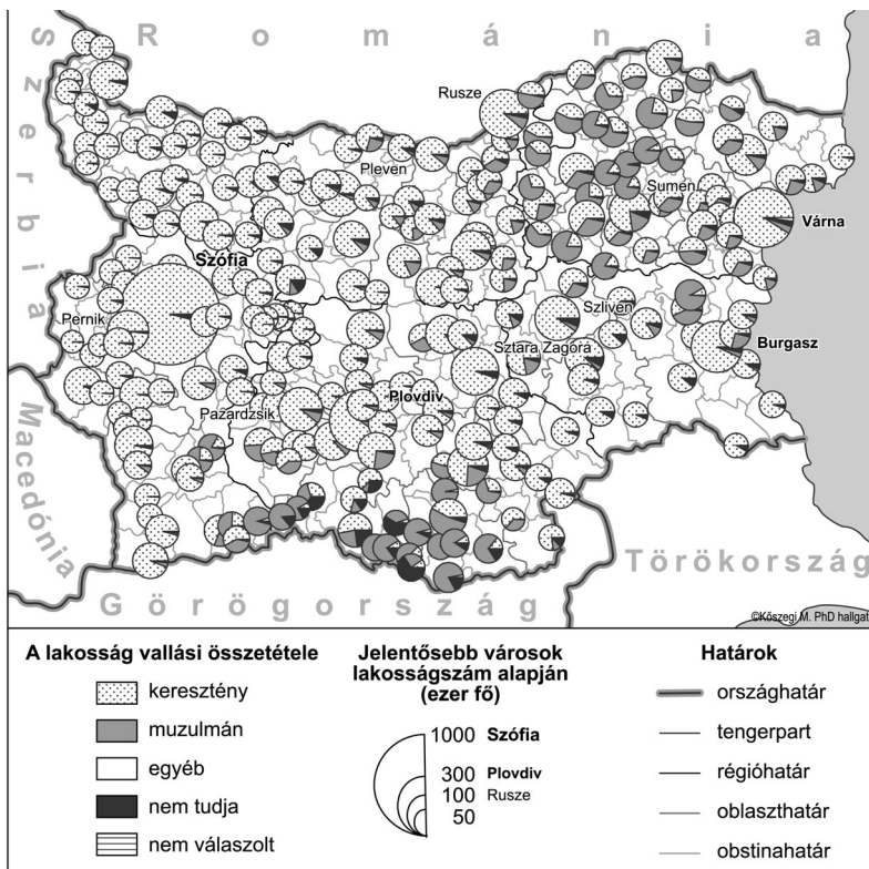
1. ábra. A Lakosság vallási megoszlása Bulgária NUTS 4-es (LAU 1-es) közigazgatási egységeiben (2001).

98,6%-a 6 552 751 fő) mellett 40 ezer főt alig meghaladó a katolikus (43 811 fő), valamint a protestáns (42 308 fő) egyházak híveinek közössége. Szintén a keresztyének számát gyarapítják az örmény egyház tagjai (6 500 fő). A zsidó vallás követőjének csupán 653 fő nyilatkozta magát. A felsoroltakon kívüli, egyéb vallási irányzathoz tartozók és a nem válaszolók aránya a 0,1%-ot alig éri el, míg a vallási hovatartozásukban bizonytalanok a lakosság 3,8%-át alkotják (1. ábra).